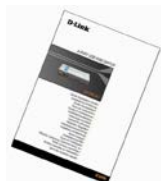
Vodič za brzu instalaciju