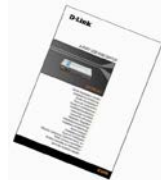
Guía de instalación rápida