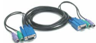
2 σετ καλωδίων KVM 3 σε 1 των