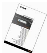
Gyors telepítési útmutató