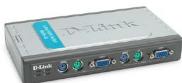
Switch KVM PS/2 DKVM-4K