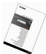
Guia de instalação rápida