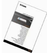
Σύντομο εγχειρίδιο εγκατάστασης