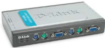
Switch KVM με 4 θύρες PS/2