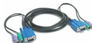
2 sæt 3-i-1 KVM-kabel