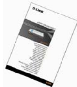
Quick Installation Guide