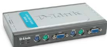
Switch KVM PS/2 DKVM-4K