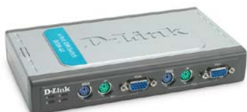
DKVM-4K PS/2 KVM stikalo