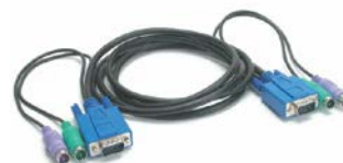
2 szett 3 az 1-ben KVM kábel