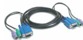
2 conjuntos de cabo de KVM 3 em 1