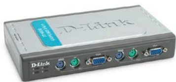
DKVM-4K PS/2 KVM switch