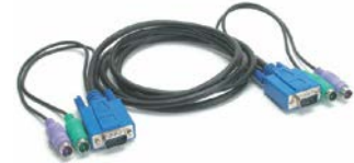
2 sarjaa KVM -kaapeleita