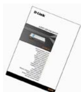
Stručný návod na instalaci